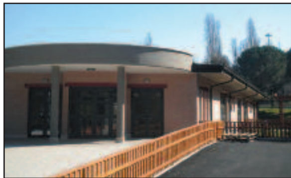
Asilo nido di via Vivanti

A breve la struttura di Mostacciano verrà consegnata al Comune di Roma.